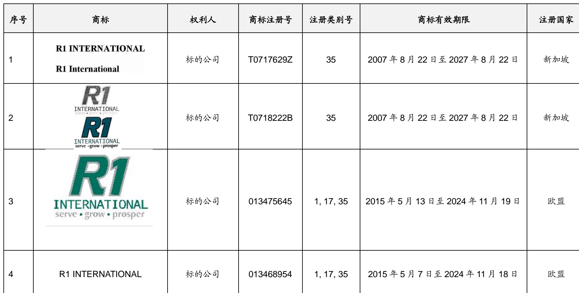
附件五：标的集团公司主要注册商标列表